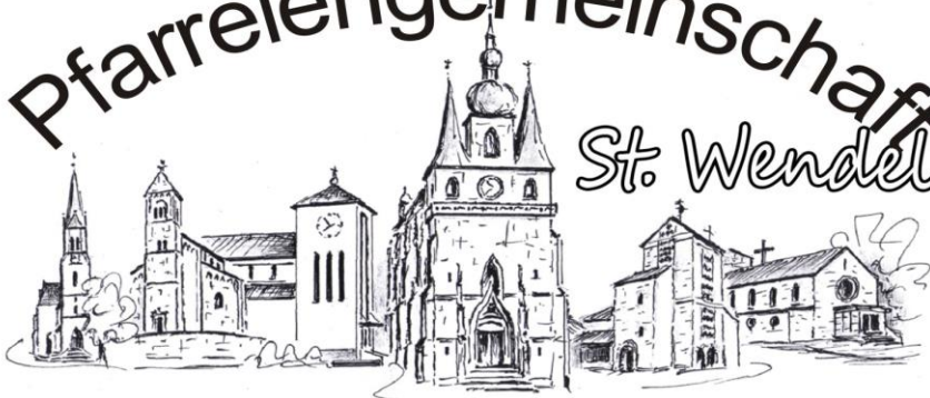
Winterbach Bliesen St. Wendel St. Anna St. Wendel Basilika Urweiler Niederlinxweiler

Nr. 13 (14. Jg.) 30. September – 13. Oktober 2024 0,60 €