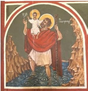
Heiliger Christophorus – Wandikone in der Krypta der Benediktinerabtei Plankstetten/Bayern